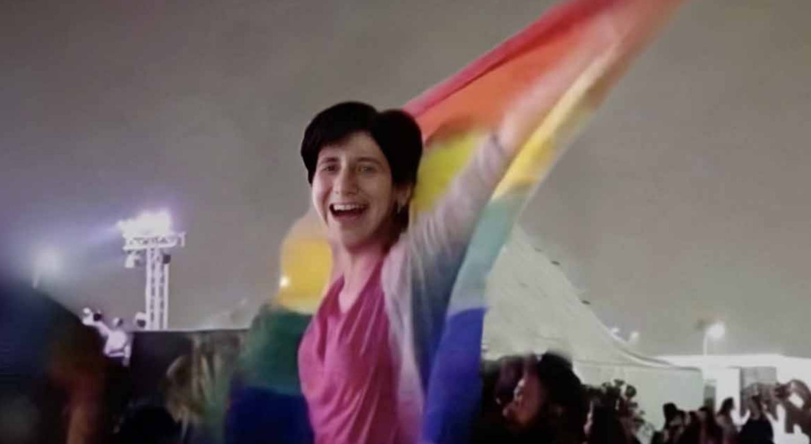
Sara Hegazy mává duhovou vlajkou na koncertě Mashrou' Leila.