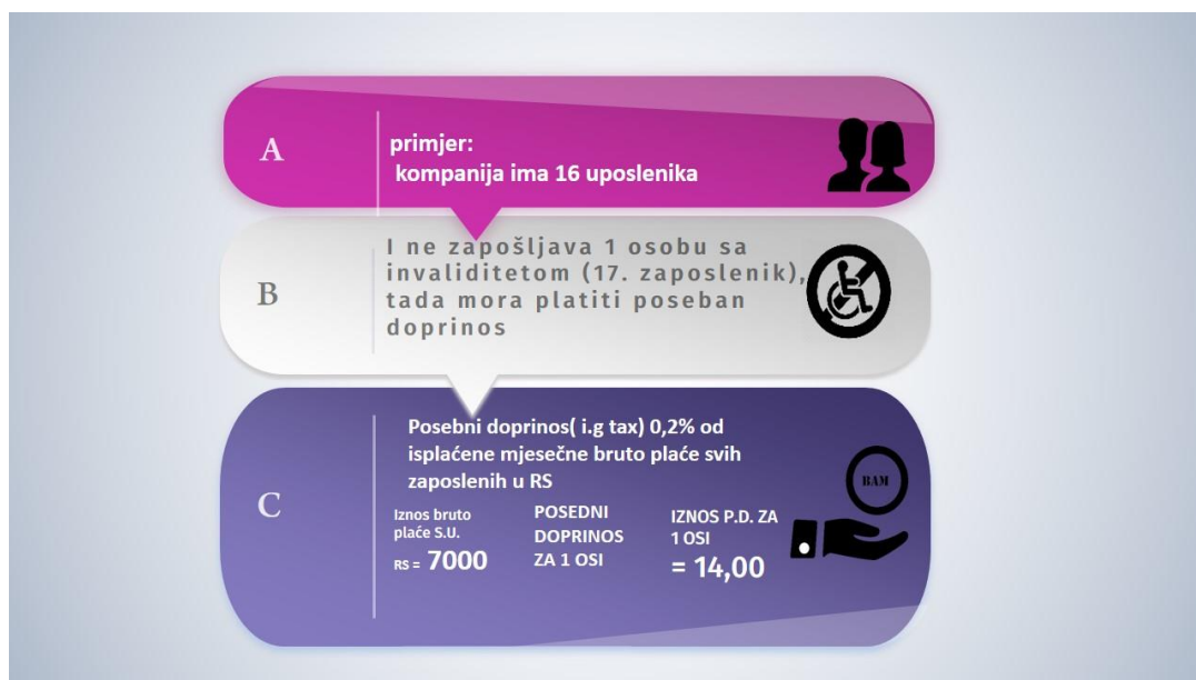
Ilustracija br. 3

invaliditetom, dužan je platiti poseban doprinos u iznosu od 0,2% od isplaćene mjesečne bruto plaće svih zaposlenih. 25 (vidi ilustraciju br.3)