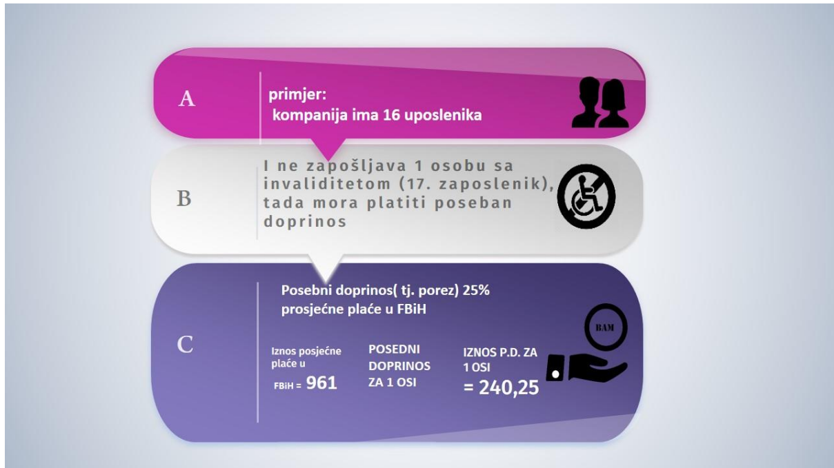
Ilustracija br. 1

Ako poslovni subjekti (kompanije) imaju manje od 16 zaposlenih, prema zakonu nisu dužni zaposliti osobu s invaliditetom. Ali oni su, takođe, obvezni platiti poseban doprinos u iznosu od 0,5% bruto plate svih zaposlenih, osim u slučaju da ipak zapošljavaju barem jednu osobu sa invaliditetom (vidi ilustraciju br. 2).